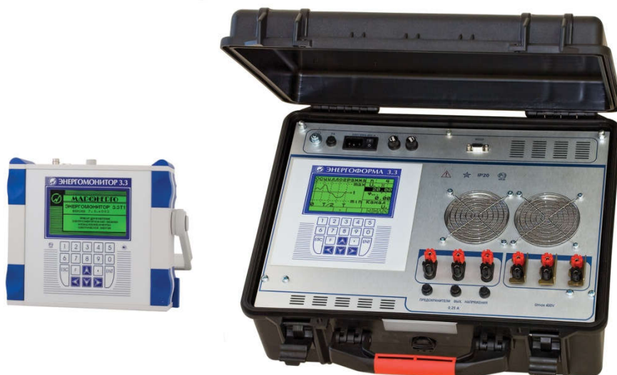
Рисунок 3. Установка "УППУ-МЭ 3.3Т1-П". Общий вид.

(Клеймение переносных установок после поверки производится в виде отиска клейма поверителя на крепежных винтах в местах, указанных стрелками).