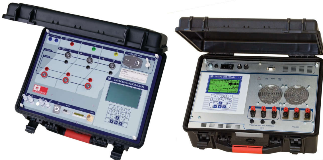
Рисунок 2. Установка "УППУ-МЭ 3.1КМ-П". Общий вид.